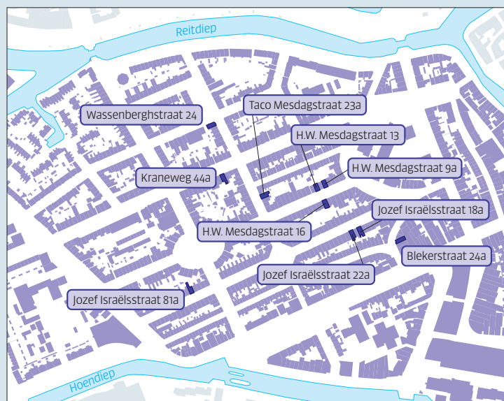
Pensions en kamerverhuur in de Schilderswijk.

In de Schilderswijk zijn vlak voor en in de oorlog veel pensions en kamerverhuurbedrijven te vinden, zoals op het kaartje te zien is. Vanaf 1933, als de nazi's in Duitsland aan het bewind komen, vluchten Joden naar Nederland, en ook naar Groningen. Sommigen stranden hier op weg naar de VS of Engeland. In het begin van de oorlog moeten Joden in Nederland op last van de Duitsers de kustplaatsen verlaten, ook zij zijn op zoek naar een nieuw onderkomen.