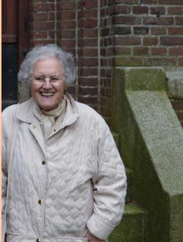
Siny Menco nu