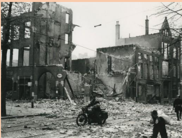
Groningen na de bevrijding

Onderstaande kaart geeft een overzicht van alle adressen in de Schilderswijk waar in totaal ca. 200 Joodse wijkgenoten zijn opgepakt, en vervolgens vermoord in Duitse vernietigingskampen. Ze woonden op 61 adressen (bron: Digitaal Monument Joodse Gemeenschap in Nederland).