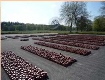
De 102 000 stenen in het Herinneringscentrum Kamp Westerbork

En dan komt in oktober het bevel, dat alle vrouwen en kinderen van wie de mannen en vaders in een werkkamp zitten naar het station moeten komen. Ze worden naar een kamp in Westerbork gebracht. Opgehaald en begeleid door agenten uit Groningen.